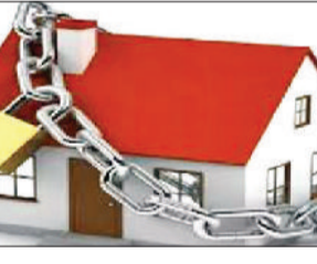
मामले में फरवरी में ईडी द्वारा गिरफ्तार किया गया था। ईडी ने कहा कि जांच में पाया गया कि ‘निर्मावत