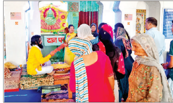
गन्नौर। आहुलाना बाबा श्याम मंदिर में अपनी मुरादों को पूरा करने की कामना करते बाबा के भक्त।