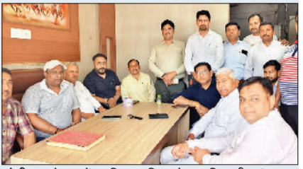
सोनीपत। बैठक में उपस्थित परिषद के पदाधिकारी एवं अन्य।