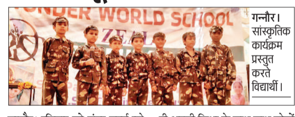
गन्ौर। सांस्कृतिक कार्यक्रम प्रस्तुत करते विद्यार्थी।