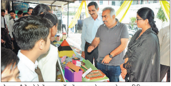
गोहाणा। टैलेंट मेले में प्रस्तुत मॉडलों का अवलोकन करते हुए अतिथिगण।